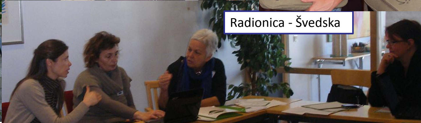
Radionica - Švedska