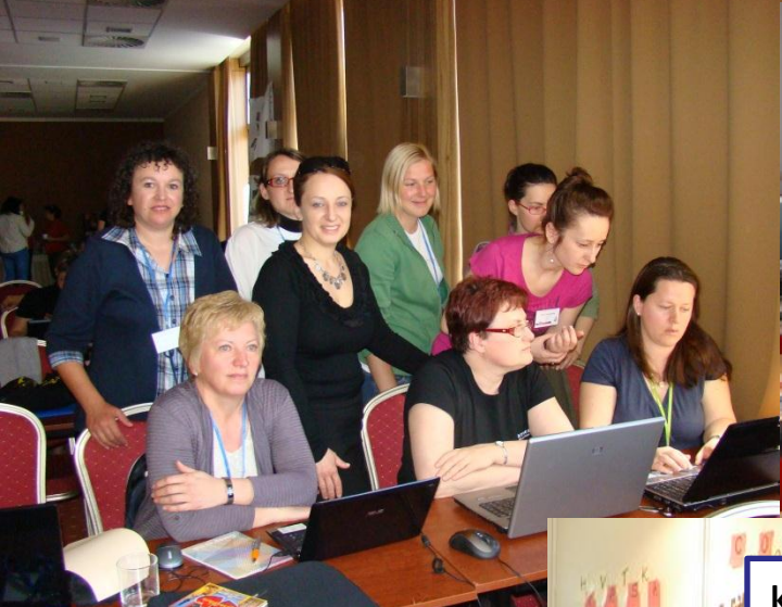
Seminar - Slovačka