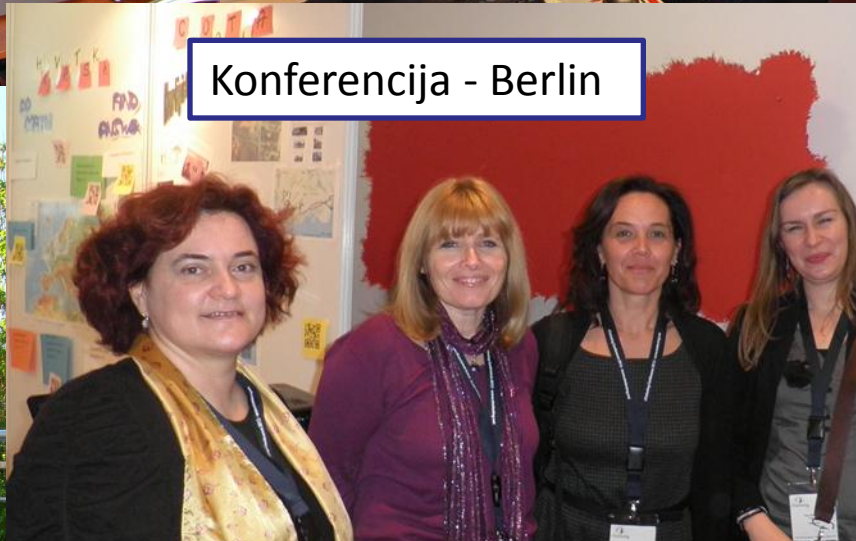
Konferencija - Berlin