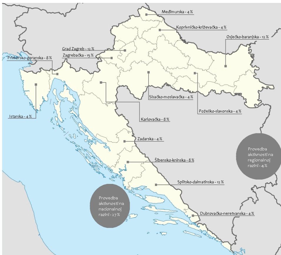
Provedba aktivnosti organizacija po županijama (prema dobivenim podacima)

Većina od organizacija koje su sudjelovale, smještena je u Središnjoj Hrvatskoj (što uključuje Zagreb i okolicu, Karlovac, Dugo Selo i Koprivnicu), zatim slijedi Južna Hrvatska te Primorje i Istočna Hrvatska. Nijedna organizacija koja je sudjelovala u istraživanju nije smještena u Zapadnoj Hrvatskoj.