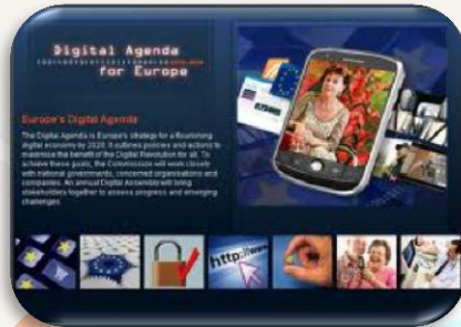
Digitalni program za EU