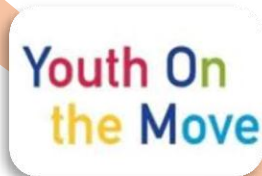
Mladi u pokretu