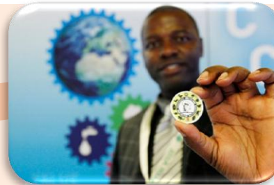
Resursno učinkovita Europa