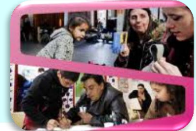
Europska platforma protiv siromaštva i socijalne isključenosti