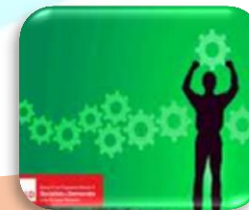
Industrijska politika za globalizacijsko doba