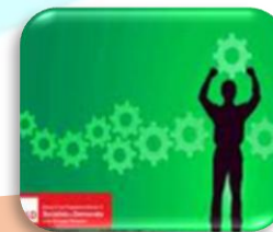
Industrijska politika za globalizacijsko doba