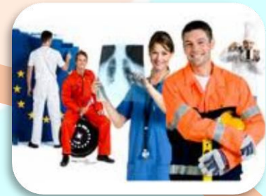
Program za nove vještine i radna mjesta