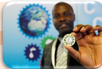
Resursno učinkovita Europa