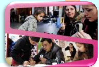
Europska platforma protiv siromaštva i socijalne isključenosti