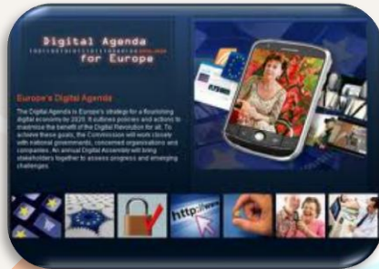
Digitalni program za EU