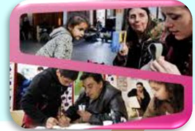
Europska platforma protiv siromaštva i socijalne isključenosti