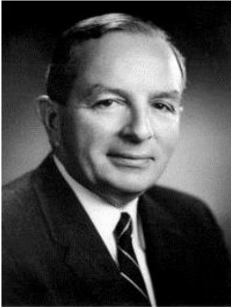
Donald Super Rođen 10. 7. 1910. Honolulu, Hawaii Umro 21.6. 1994. Savannah, Georgia