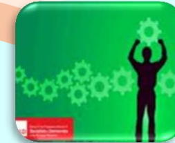
Industrijska politika za globalizacijsko doba