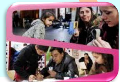
Europska platforma protiv siromaštva i socijalne isključenosti