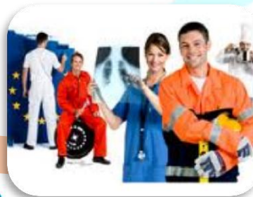
Program za nove vještine i radna mjesta